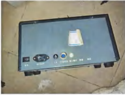
摩托车尾气分析仪