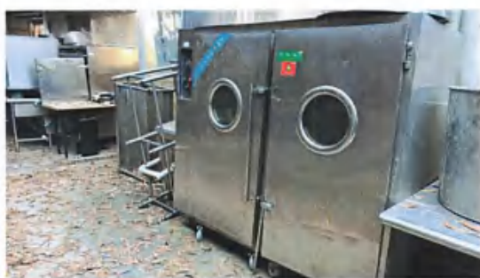
大型高温消毒碗柜