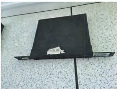
统一威胁管理主机