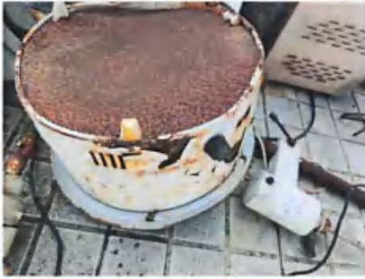
实验室试管干燥器/玻璃仪器烘干机