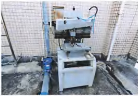
半自动锡膏印刷机