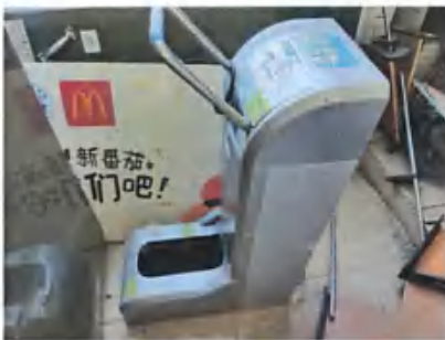
微电脑智能鞋套机