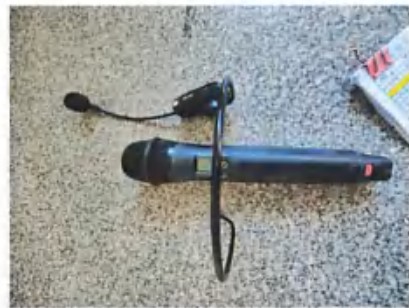
无线 UHF 麦克风