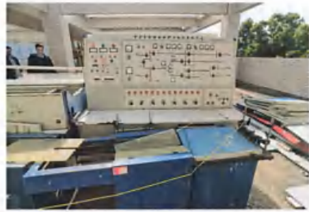
电力系统继电保护工培训考核平台