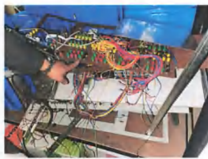
电工高级工考核设备